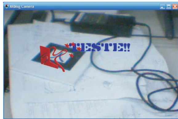
Figura 4. Janela da câmera do ARMsg.

Estes sinais são associados a slots (funções que são chamadas quando o sinal associado a ela é ativado), para que este faça o procedimento necessário.