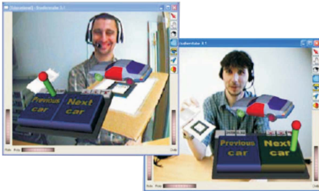
Figura 1. Screenshot do sistema de videoconferência com RA apresentado em [2].

uma aplicação de virtualidade aumentada, inserindo os streams de vídeo em um ambiente virtual.